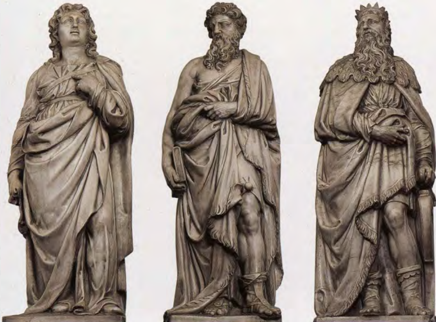
De cyclus van zes profeten die Robrecht de Nole voor de centrale ruimte van de basiliek beeldhouwde, na 1622.