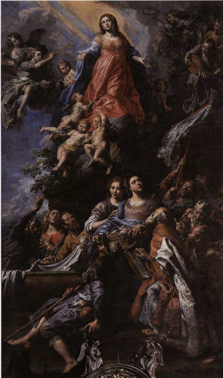
Andreas, Petrus, Paulus en Jakobus: belangrijke 'officieren' van de hemelse troepenmacht op De tenhemelopneming van Maria, een schilderij van Theodor Van Loon voor het hoogaltaar van de basiliek, tussen 1622 en 1628.