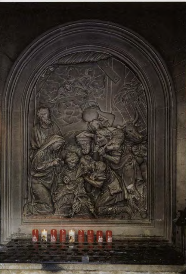
Bas-reliëf uit een van de zeven buitenaltaren (zeventiende eeuw) die elk een vreugde of smart van Onze-Lieve-Vrouw verhalen. Hier is de Aanbedding der Herders uitgebeeld.