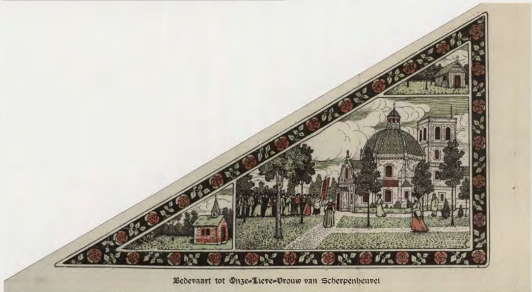
Bedevaart tot Onze-Lieve-Vrouw van Scherpenheuvel

Bedevaartvaantje, ca. 1900, tweezijdig bedrukt, zinkografie, papier. Aan de ene zijde (onder) de eik en het beeld waarmee alles begon. Aan de ommezijde (boven) de houten en de stenen kapel en de bedevaartkerk.