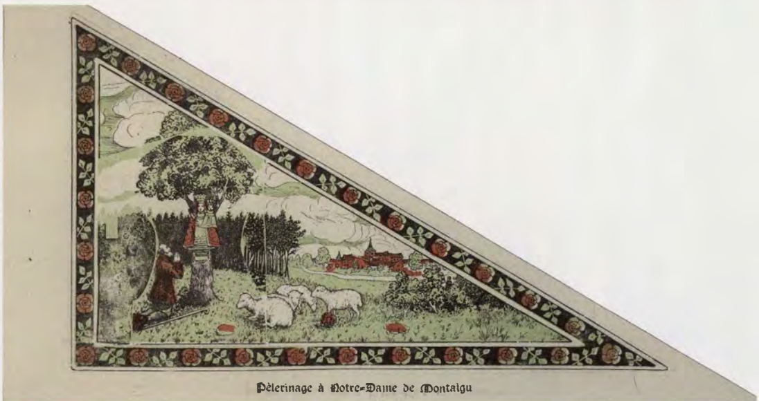
Pèlerinage à Notre-Dame de Montalgu

Bedevaartvaantje, ca. 1900, tweezijdig bedrukt, zinkografie, papier. Aan de ene zijde (onder) de eik en het beeld waarmee alles begon. Aan de ommezijde (boven) de houten en de stenen kapel en de bedevaartkerk. KADOC – K.U.Leuven