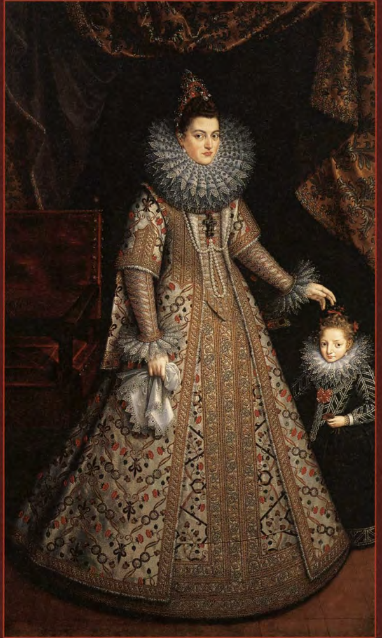
De aartshertogen Albrecht en Isabella door Frans II Pourbus, 1599.

Patrimonia Nacional, Monasterio de las Descalzas Reales, Madrid