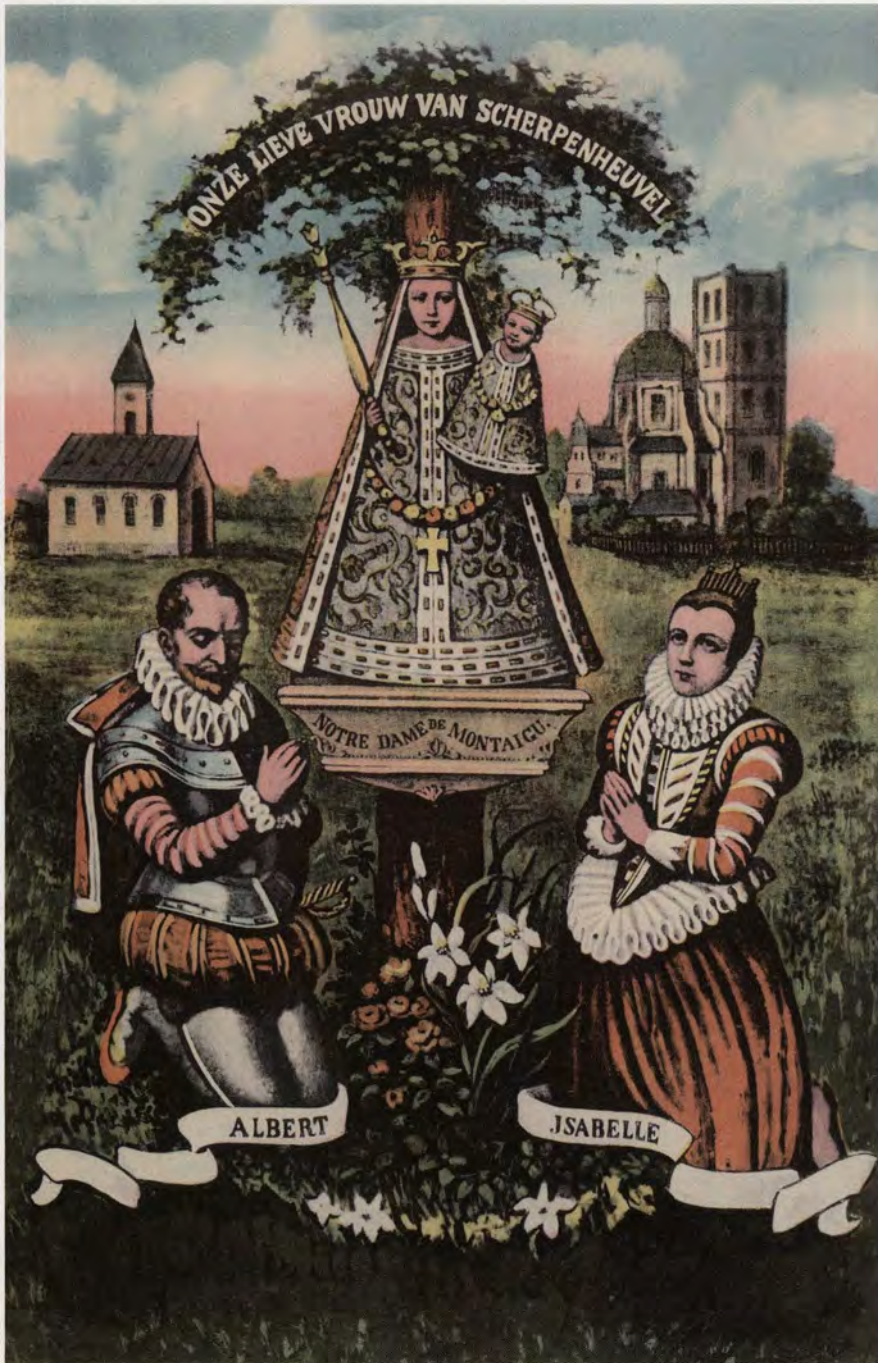
Scherpenheuvel: het project van Albrecht en Isabella. Ingekleurde postkaart, verstuurd in 1930.