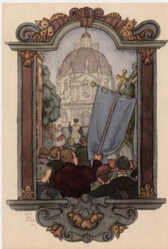
De pelgrims hebben het einde van de tocht bereikt. Belgische Boerenbond en Boerenjeugdbond uit Oost-Brabant en de Antwerpse Kempen op bedevaart naar Scherpenheuvel, 1957