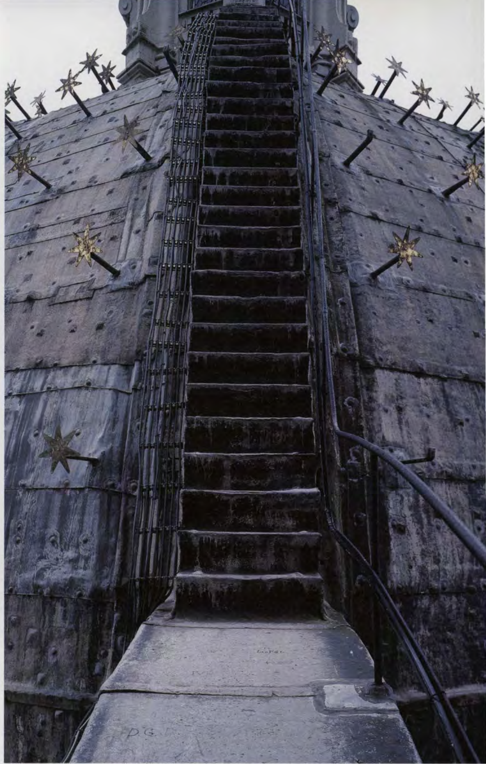
De Jacobs ladder. Over een van de ribben van de koepel loopt een trap. Zoals zijn bijbelse voorbeeld klimt hij omhoog tussen de sterren.

versperde tot het Aards Paradijs. De tak met lelies van Gabriël is een vast onderdeel van de iconografie van Maria-Boodschap. Op basis van die gegevens, valt het niet moeilijk de engelen te duiden. De aartsengel Michael verwijst naar de gevolgen van de zondeval. Van generatie op generatie beladen met de erfzonde, is de mens voortaan sterfelijk. Bovendien wordt hem de toegang tot de hemel ontzegd. De Heilige Maagd, die bovenop het timpaan van het poortgebouw verschijnt, staat letterlijk en figuurlijk boven zonde en dood. Bij de boodschap van de aartsengel Gabriël heeft ze haar fiat gegeven. Daardoor is ze de nieuwe Eva geworden en heeft ze de poort van de hemel opnieuw voor de mensheid geopend. Om die reden eren de katholieken haar met het embleem van de Porta caeli of Hemelpoort.