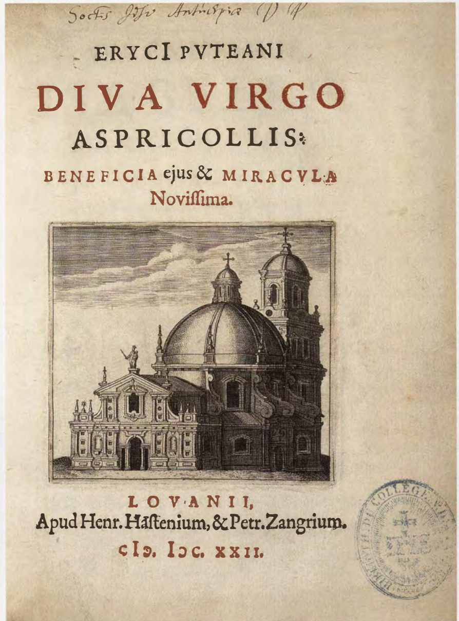
De bedevaartkerk met het niet gerealiseerde torenontwerp. Kopergravure op de titelpagina van Puteanus, Diva Virgo Aspricollis , Leuven, Van Haften en Zangrius, 1622.

Bezoekers die in de zeventiende en achttiende eeuw tot op het dak van de onafgewerkte toren zijn geklommen, hebben de mariale symboliek van het gebouw nog ten volle kunnen ontraadselen. Daarna heeft de ontmanteling van de vestingwerken de site vermindert. Op het moment dat de fortificaties er nog staan, roept de gordel van bastions die rondom de toren en de kerk is aangelegd, de propugnacula van het bijbelvers op. Bij het afdalen van de trap komt men voorbij de schatkamer. Ze is letterlijk volgestouwd met votiefgaven die herinneren aan de gunsten die generaties pelgrims bij de Madonna van Scherpenheuvel hebben afgesmeekt. Het zijn evenzoveel trofeeën van de overwinningen die de Heilige Maagd op het kwaad heeft behaald. De opvallende tabletten die in de vensters op de zijgevels van de toren zijn aangebracht, dienen wellicht een gelijkaardig doel. Ze lijken voorbestemd om er inscripties op aan te brengen en zo de roemrijke daden van Onze-Lieve-Vrouw te verkondigen. Op het gelijkvloers staat de bezoeker in de sacristie, de bewaarplaats van liturgische gewaden en vaatwerk. Dit is het arsenaal waarmee de Katholieke Kerk haar vijanden bekampt en waarmee ze bijdraagt tot het heil van de gelovigen.