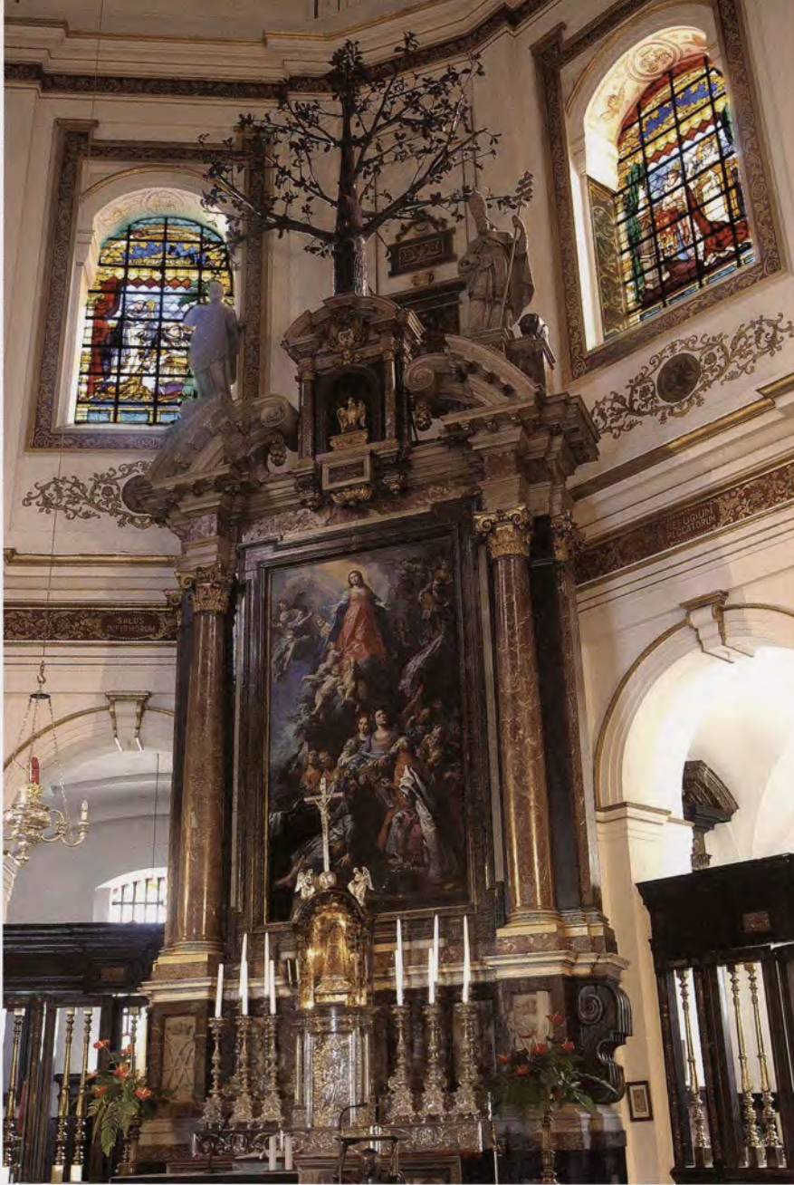
Het hoogaltaar staat op de plaats waar vroeger de eik groeide.

De originaliteit van Scherpenheuvel ligt niet in de architectuurtaal. Ze moet echter gezocht worden in het emblematische discours. Het brengt een systematisch en op zichzelf staand verhaal. Dat blijkt het duidelijkst uit de inplanting van de bedevaartkerk. In tegenspraak met de traditie, is ze niet georiënteerd op Jeruzalem. Integendeel, zoals eigen aan elke centraalbouw, is ze in zichzelf besloten. Het perspectief verwijst niet naar Jeruzalem, maar is op het hoogaltaar gericht. Dat staat in de meest noordelijke hoek van de zevenhoek en markeert de plaats waar eertijds de eik stond. Zo treden de aartshertogen in de voetsporen van Abraham, Jakob, Jozua en Gideon en bouwen ze hun altaar op de plaats waar God zich heeft geopenbaard. De ruimtelijke organisatie van de kerk maakt het de pelgrim duidelijk dat hij het einde van zijn tocht bereikt heeft. Hij is binnengetreden in het Nieuwe Jeruzalem. Onder de koepel van de bedevaartkerk bevindt hij zich in het heilige der heiligen van de nieuwe tempel. Hij staat er oog in oog met de Ark van het Nieuwe Verbond, het wonderdadige Madonnabeeld. Het troont in een nis bovenaan het hoogaltaar. Men zou kunnen denken dat het zijn oorspronkelijke plaats aan de eik nooit verlaten heeft. In de negentiende eeuw wordt het beneden op het hoogaltaar geplaatst.